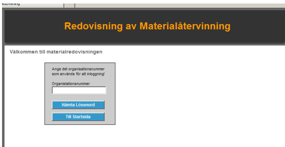
BILD 2 GLÖMT LÖSEORDET

Ange organisationsnumret i rutan nedan (bild 2) så kommer lösenordet att skickas till dig på mail. Om du inte får något mail inom 5 minuter kontakta Berg & Ström System AB. Gäller ej SBR:s och Refero:s medlemmar ni kontaktar respektive administratör.